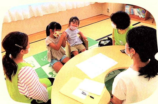
和やかな雰囲気の中で行われた顔合わせ。子どもも笑顔で自己紹介していき安心