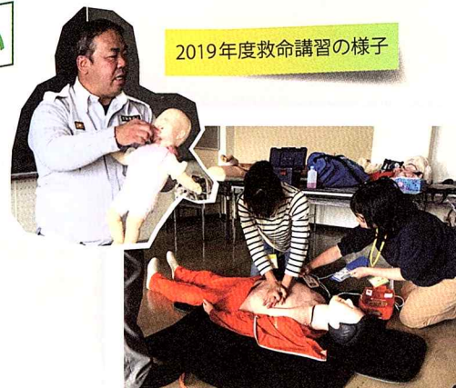
2019年度救命講習の様子

※コロナウイルス感染症の影響により、中止、延期になる場合があります。最新情報はいとしまファミサポホームページかお電話で確認ください。