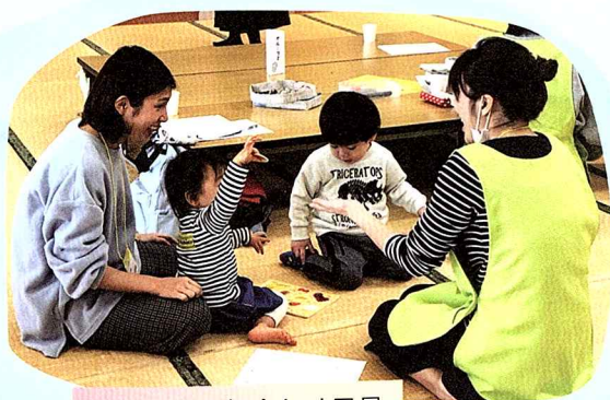
交流会での顔合わせ風景

初めての援助活動はおねがい会員・サポート会員だけでなく、お子さんにも不安があります。堅苦しい対面ではなく、気軽な話題から入ると打ち解けやすいです。サポート会員は顔合わせの前に年齢に応じた発達を頭に入れておき、お子さんが不安にならないよう環境を整えておくといいですね。おねがい会員は、お気に入りのおもちゃなどを持って行き、いつもの様子を話しながら実際に遊んでみるのも。サポート会員も声掛けや抱っこをしてみたり、一緒に遊んでみたりするなど、顔合わせには30分以上かけて、お互いの信頼関係を築いていきましょう。